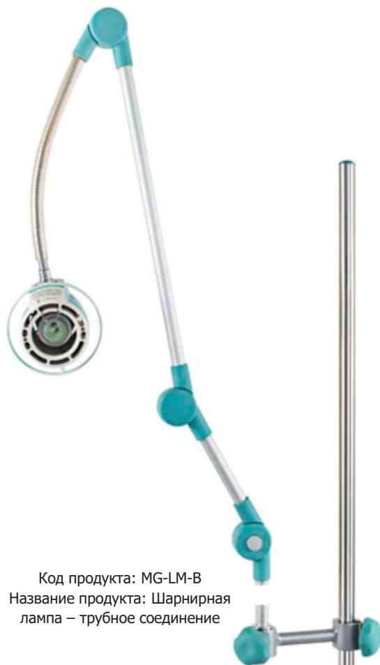
Код продукта: MG-LM-B Название продукта: Шарнирная лампа – трубное соединение