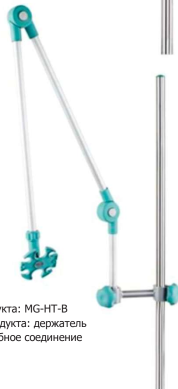
Код продукта: MG-HT-B Название продукта: держатель шлангов трубное соединение