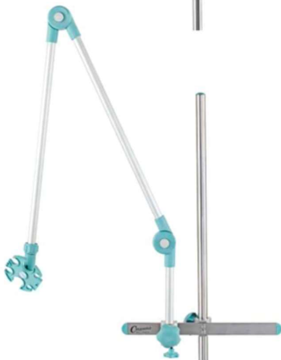
Код продукта: MG-HT-R Название продукта: держатель шлангов рельсового типа