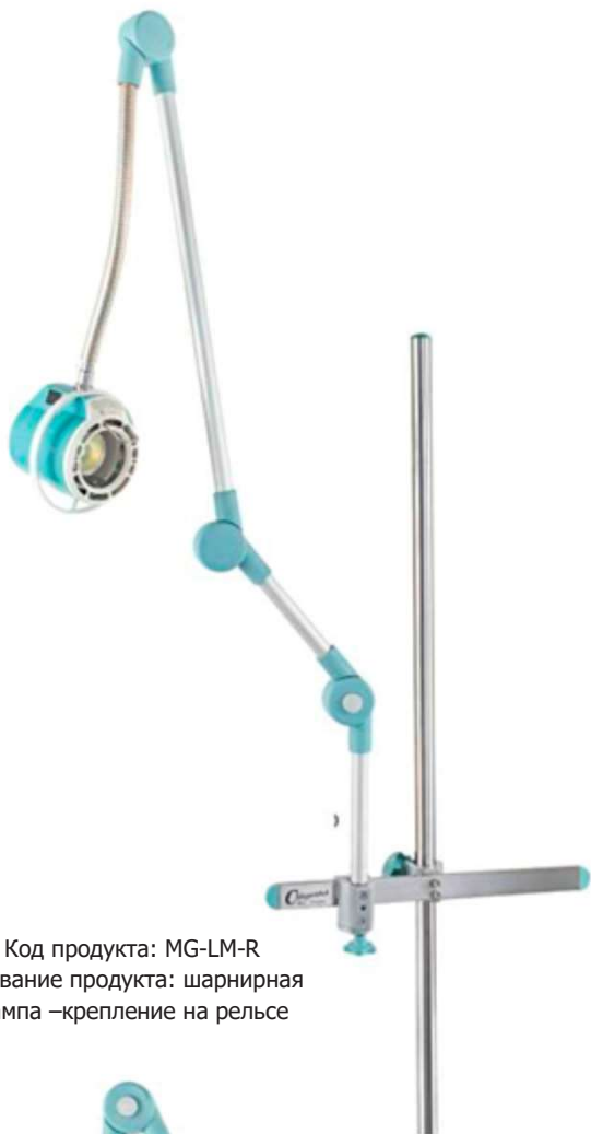
Код продукта: MG-LM-R Название продукта: шарнирная лампа –крепление на рельсе